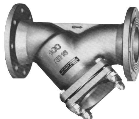
FILTRE OBLIQUE A BRIDES PN 10 TYPE FILTRAM DN 100

Le FILTRE OBLIQUE A BRIDES, TYPE "FILTRAM", SÉRIE "CM", doit être installé en amont des appareils régulateurs et autres selon la direction d'écoulement indiquée par une flèche sur le corps de l'appareil.